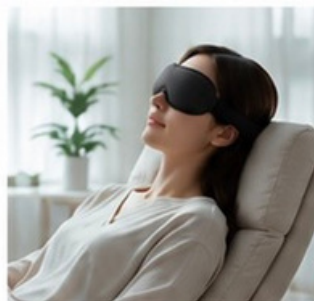
リラックスタイムに