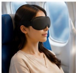
飛行機・新幹線での移動に